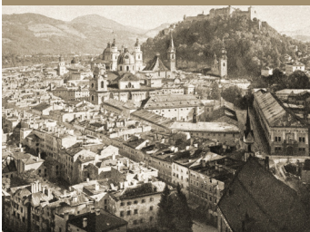
Lithografie von Edmund Kneber