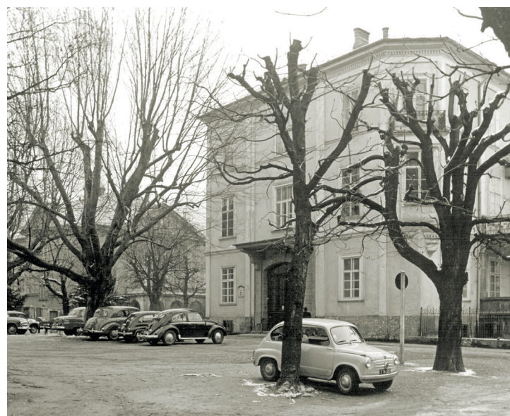
Das Gebäude der Landwirtschaftskammer Salzburg vor dem Umbau 1958. Wo damals die Autos parkten, befindet sich heute die Abfahrt zur Raiffeisengarage.

Auch in Salzburg übernahm 1938 der Reichsnährstand die Rechtsnachfolge vom Landeskulturrat. Erst 1945 traten mit der Aufhebung der Reichsnährstandsgesetzgebung die früheren Rechtsvorschriften wieder in Kraft, somit auch das Salzburger Gesetz über den Landeskulturrat. Dieses wurde durch das am 10. März 1949 beschlossene Salzburger Landwirtschaftskammergesetz abgelöst, das den Grundstein für die heute bestehende Kammerorganisation bildet.