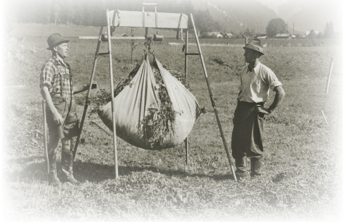
Silierversuche im Lungau 1958

Auf dem Weg zur Schaffung einer funktionsfähigen Interessenvertretung der Land- und Forstwirtschaft leistete Salzburg Pionierarbeit. Vor 100 Jahren wurden mit der Errichtung des Landeskulturrates die gesetzlichen Grundlagen für eine bäuerliche Interessenvertretung geschaffen. In einer Zeitreihe wirft der „Salzburger Bauer“ einen Blick auf die Entwicklung der Land- und Forstwirtschaft seit der Bauernbefreiung im Jahr 1948.