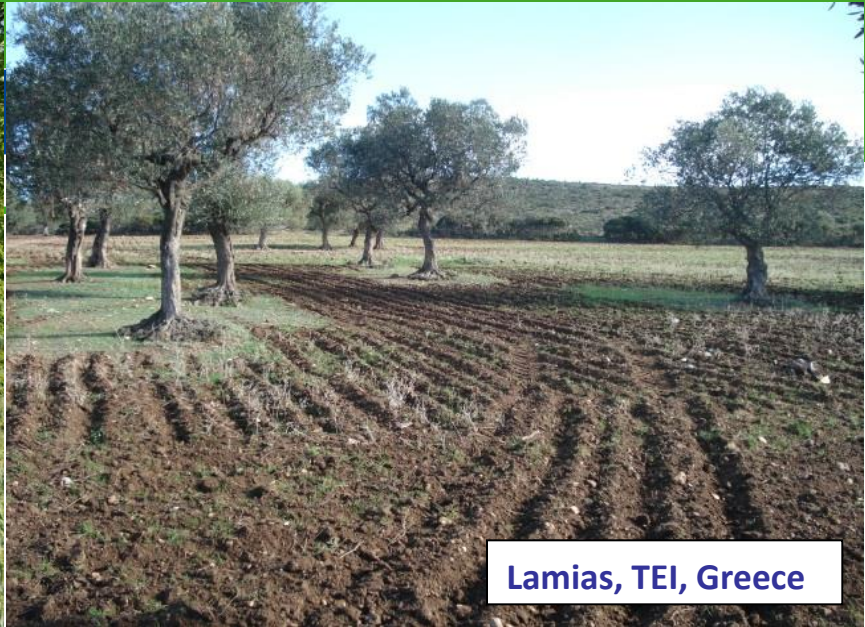
Lamias, TEI, Greece