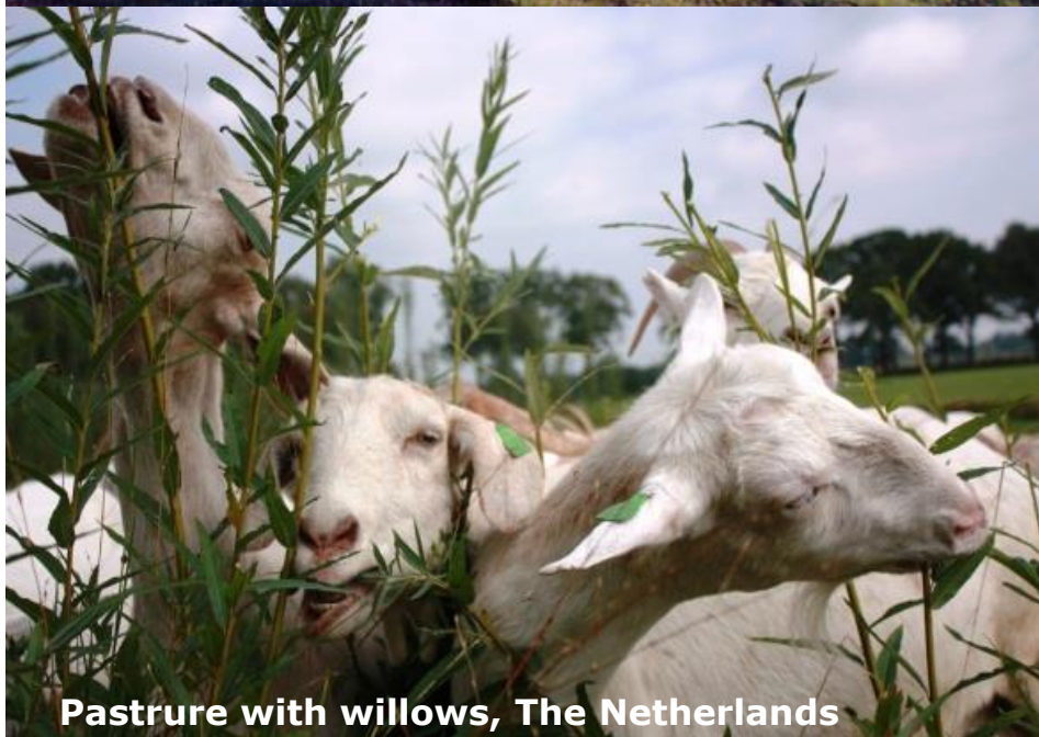
Pastrure with willows, The Netherlands