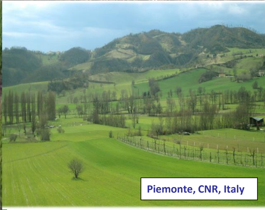
Piemonte, CNR, Italy