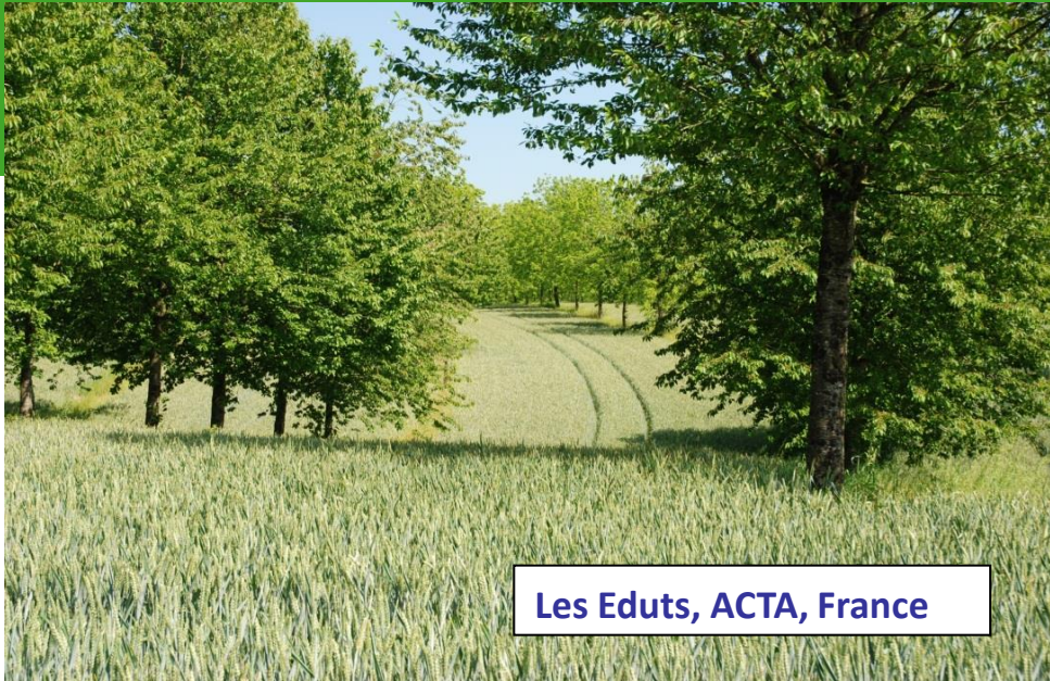
Les Eduts, ACTA, France