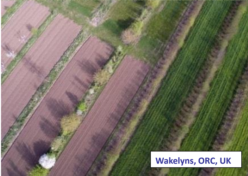
Wakelyns, ORC, UK