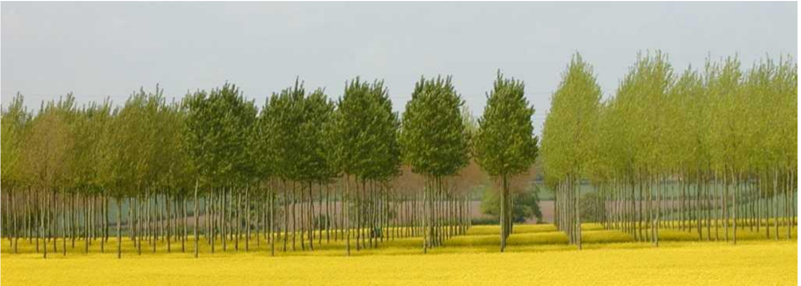
Silsoe, Cranfield, UK

dass 100 ha agrarforstlich genutzte Flächen produzieren im gleichen Ausmass als 140 ha konventionell genutzte Flächen (Baum- und Feldfrüchte getrennt)