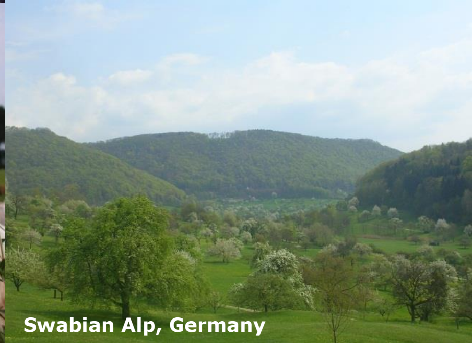
Swabian Alp, Germany