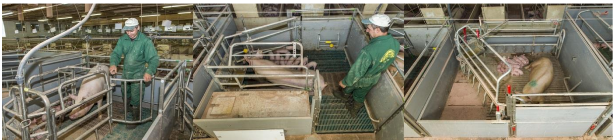
Abbildung 1: Im Rahmen des Projekts entwickelte und untersuchte Abferkelbuchtentypen – Flügelbucht, Knickbucht und Trapezbucht

Da zum Zeitpunkt der Veröffentlichung der Änderung der 1. THVO weder am österreichischen noch internationalen Markt ein praxistaugliches, verfahrenssicheres System mit zu öffnendem Abferkelstand verfügbar war, wurde es notwendig im Rahmen des Projekts neue Abferkelbuchten bzw. Modellvarianten davon zu entwickeln. Aus einer umfangreichen Entwicklungsarbeit innerhalb des LK-Projekts gingen insgesamt sieben Prototypen hervor, von welchen drei Buchtentypen („LK-Buchten“) in den Hauptversuch übernommen wurden: „Flügelbucht“, „Knickbucht“ und „Trapezbucht“ (siehe Abb. 1). Ergänzend wurden zwei am internationalen Markt verfügbare Buchtentypen getestet: „SWAP-Bucht“ (Dänemark) und „Pro Dromi“ (Holland). Diese zwei Konzepte bieten zwar eine Fixierungsmöglichkeit, sind aber grundsätzlich auf eine freie Abferkelung ausgerichtet – eine Fixierung der Sau ist nur in Ausnahmefällen angedacht. Deren Flächenangebot geht mit 6 m 2 bzw. 7,4 m 2 deutlich über das gesetzlich definierte Mindestmaß von 5,5 m 2 hinaus.